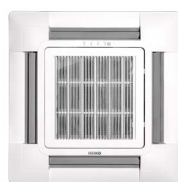
Abdeckung PB-700HE4 (Option)